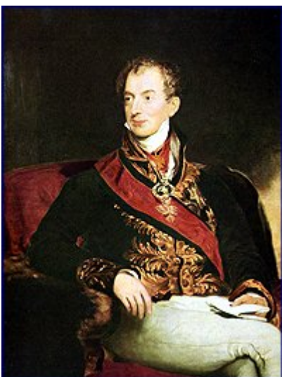
Kuva I. Klemens von Metternich