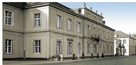
Kuva II. Marcolinin palatsin pohjoisfasadi