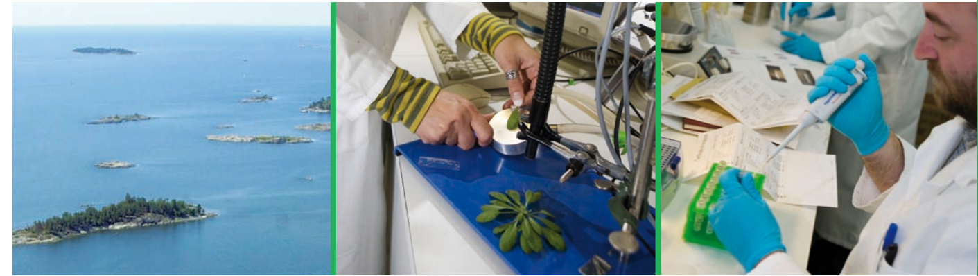
Yagut Allahverdieva mittaa klorofyllin fluoresenssia lituruohosta.