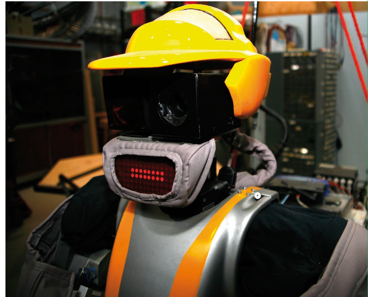
WorkPartner-robotin avulla tutkitaan ja kehitetään uuden sukupolven palvelurobotiikkaa.

Tehokas verkottuminen on tärkeä osa huippuyksikön organisaatiota. Huippuyksikön omassa infrastruktuuriohjelmassa kehitetään tulosten todentamiseen soveltuvaa laiteympäristöä, jota voidaan käyttää fyysisesti kahdella eri paikkakunnalla sijaitsevista yksiköistä. ”Verkkolaboratoriossa tutkijat voivat internetin kautta käyttää Otaniemessä ja Tampereella sijaitsevia laitteita ja koneita.” Toimivan ympäristön luominen on kovatasoinen haaste jopa kansainvälisesti mitattuna.