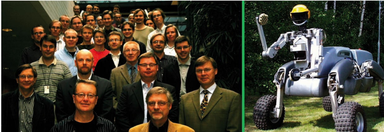
Älykkäiden koneiden huippuyksikkö.