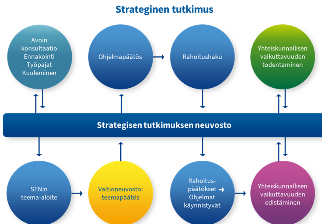
Kuva 1. Strategisen tutkimuksen neuvoston toiminta ja yhteiskunnallisen vaikuttavuuden edistäminen sen osana.

Strategisen tutkimuksen neuvoston (STN) toiminnassa tutkimuksen yhteiskunnallinen vaikuttavuus kulkee punaisena lankana teema-aloitteista rahoitettujen tutkimusohjelmien arviointiin asti. STN tekee vuosittain valtioneuvostolle teema-aloitteen laajoista Suomen yhteiskunnan tulevaisuudelle keskeisistä haasteista. Valtioneuvoston teemapäätöksen jälkeen STN avaa teemoista ohjelmahaut. Ohjelmakokonaisuudella tavoitellaan suurempaa vaikuttavuutta kuin erillisten hankkeiden kokoelmalla on mahdollista saavuttaa. Kun STN valitsee rahoitettavat hankkeet, arviointikriteereinä käytetään tieteellisen laadun ohella yhteiskunnallista merkittävyyttä ja vaikuttavuutta. Rahoituspäätöksiä tehdessään STN myös arvioi, millaisen ohjelmakokonaisuuden hankkeet yhdessä muodostavat. Kullekin ohjelmalle valitaan myös hankkeiden ja ohjelmien välistä koordinaatiota ja yhteistyötä edistävä ohjelmajohtaja. Ohjelmien loppuessa arvioidaan niiden tieteellinen ja yhteiskunnallinen vaikuttavuus.